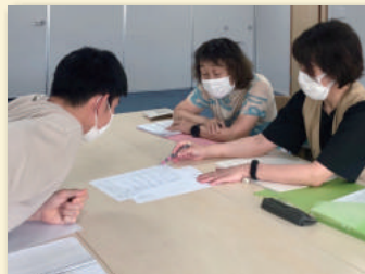
外国人スタッフのサポートをする 応援隊員(右2人)

外国人介護スタッフの支援に関心のある方 日本語教師、日本語ボランティア経験者 語学教育関係者、アジア駐在経験者 医療・介護職経験者 日本語や外国語を学ぶ学生 など